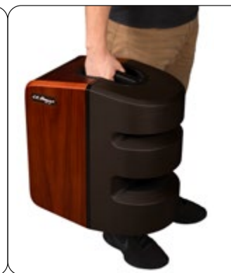
Angenehmer Tragegriff für leichten Transport